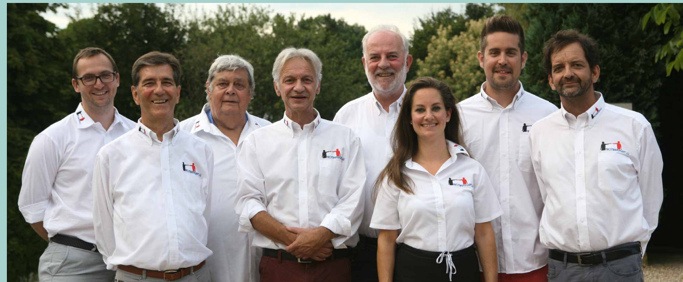
Comité de | Vorstand von | Committee of protransplant.lu

Il n'est pas facile de se voir confronté à des problèmes de santé graves, surtout quand on est jeune. En raison d'une maladie rénale fatale, j'étais obligé d'aller en dialyse pendant trois années. C'était une période longue et dure, pendant laquelle mon état, physique et mental, s'est progressivement dégradé. C'était un moment tout à fait extraordinaire pour moi, quand, en novembre 2014, la nouvelle tombait, qu'un rein compatible était disponible pour moi. La transplantation s'est réalisée dans de bonnes conditions. Aujourd'hui, je peux à nouveau mener une vie normale et pratiquer mon sport. Je suis extrêmement reconnaissant envers le donneur d'organes et sa famille. Par son don, il m'a permis de retrouver une nouvelle vie.